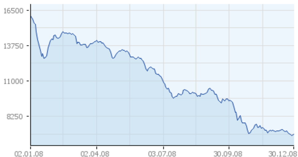
Notowania sWIG80 w 2008 roku

W 2008 roku KOGENERACJA S.A. była spółką notowaną na Gieldzie Papierów Wartościowych w Warszawie w notowaniach ciągłych w indeksie sWIG80. Aktualnie, po sesji w dniu 20 marca 2009 roku Spółka opuściła indeks sWIG80 i jest nową spółką w indeksie mWIG40 (komunikat Zarządu Giełdy Papierów Wartościowych w Warszawie z dnia 5 lutego 2009 roku).